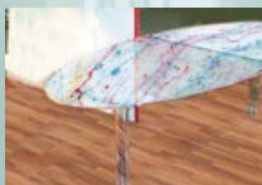
Effektlakering bag glas: Efter påføring af GDL som grunder kan man f.eks. lave spindelvævs- eller dråbeeffekter.