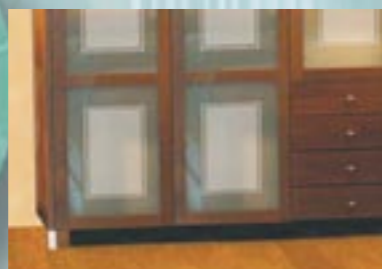
Farveløs lakering: Sandblæst glas får man ved tilsætning af strukturpulver i glaslakken.