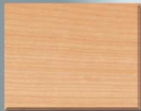
Supermat finish på kirsebær