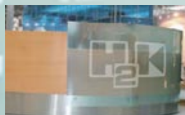
Skabelon teknik: Utallige muligheder – alle bogstaver, tal, mønstre og former kan laves.