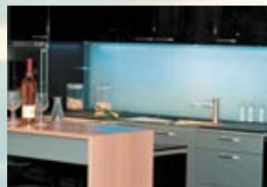
Farvet lakering: Fra laserende til dækkende. Ethvert farveønske kan efterkommes.

Efter en grundig afrensning af glasfladen påfører man ganske enkelt SPECIAL GlasDesignLak GDL i ønsket effekt. Effekten opnår man ved at tilsætte f.eks. strukturpulver eller Wigranit Nova-Color som angivet i brugsanvisningen.