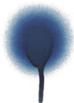
Sprøjtebillede Standard spraydåse